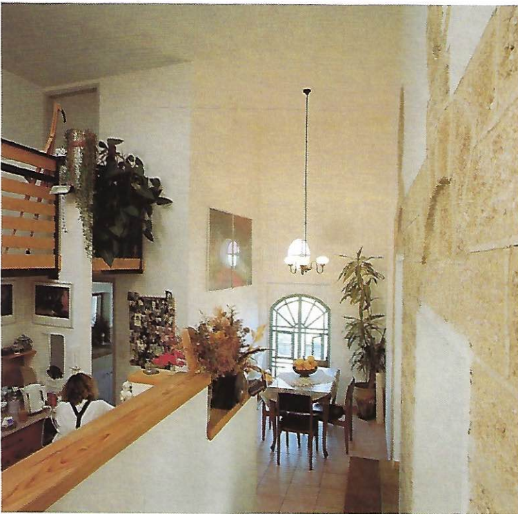
קיר "תפאורה" מוליך לחדר האוכל

בוגרת בצלאל המחלקה לעיצוב סביבה 1985. בוגרת הטכניון הפקולטה לאדריכלות ובינוי ערים 1988.